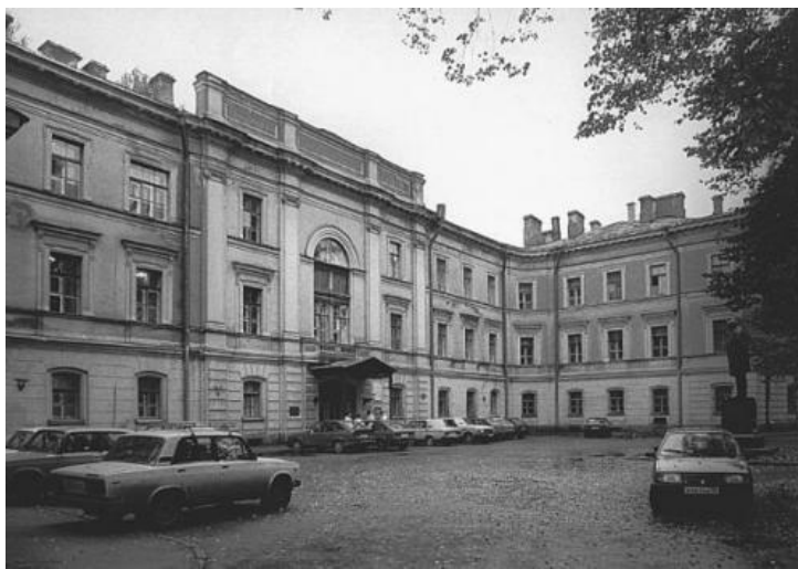
Корпуса Михайловской клинической больницы, современная фотография.