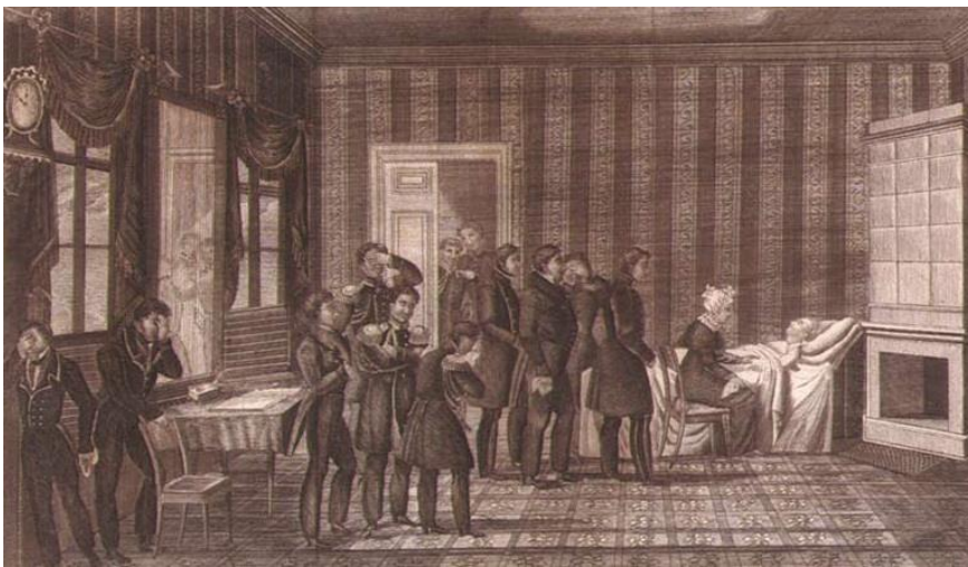
Кончина Александра I в Таганроге. Из книги Н.Я. Данилевского.

от власти монарх инсценировал свою смерть и много лет жил затем в уединении, в отшельничестве в Сибири под именем старца Федора Кузьмича. Не исключал этой версии и Лев Толстой. Старец Федор Кузьмич - историческое лицо, он славился высокой образованностью, скрывал свое происхождение, умер в 1864 г. в Томске и был канонизирован Русской православной церковью, его мощи сохранились близ этого сибирского города. Между тем, императора похоронили в закрытом гробу, а